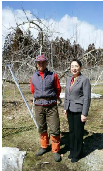
りんごの剪定作業