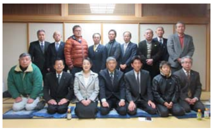
昭和村役員懇親会