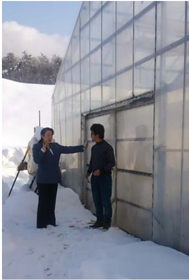
雪深いレタスハウスを視察