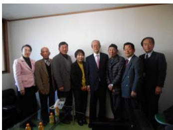
稲姫会のみなさんと

▼農水省が作成中の平成28年度の職業・農業・農村白書案に「中山間地」という、非常に大きな言葉が抜けていると感じました。自民党では「中山間地農業を元気にする委員会」を立ち上げ、農業振興への提言をまとめ、中山間地対策の本格検討を始めたばかりです。農政での「中山間地農業」の位置付けを検討して頂けるよう、白書案への明記を強く要請致しました。