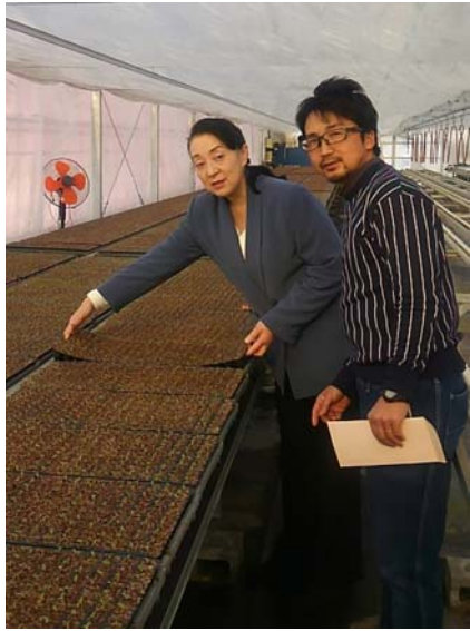
ハウスの中では新芽がたくさん!

多岐にわたる施策を総合的かつ計画的に推進するため活動をされています。また昭和村では若手の農業経営者の方からレタス・ほうれん草・蒟蒻・キャベツ等について栽培方法やその販売の方法に関して意見を伺いました。後日実際にレタスの発芽状態等を視察させて頂きました。こういった皆様の生の声、現場の情報を実際見聞きして、今後の活動に役立てて参ります。