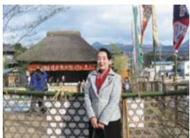
▲国指定重要無形文化財 渋川市赤城町上三原田の歌舞伎 歌舞伎の演じ手だけではなく、舞台操作の 技術・衣裳等も文化財であり、着実に伝承 していく事が重要です