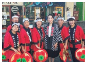
▲前橋まつり八木節の皆様と 暑さを吹き飛ばすような 凄いパワーでした