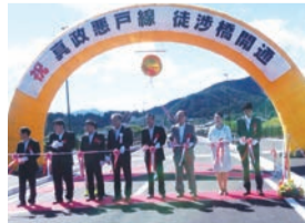
▲みなかみ町 徒渉橋開通式 利根川に架かる徒渉(ただ わたり)橋が開通し、地元生活の 利便性が向上されました