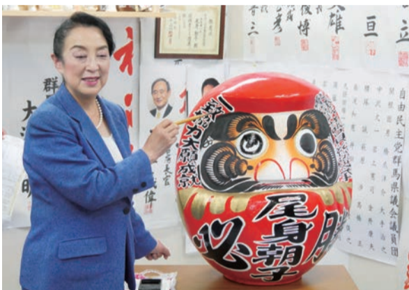
▲戦いを制したダルマの目入れ

昨年行われました第48回衆議院議員総選挙におきまして、自民党公認候補として群馬1区より立候補し、92,641票の得票を頂いて2期目の当選を果たすことができました。大変厳しい戦いではありましたが、遊説先や演説会など行く先々で、皆様の温かいそして力強いご支援の声をたくさん頂戴致しました、本当にありがとうございました。皆様から頂きましたご期待にしっかりと応えることができますよう、日々の活動に誠心誠意全力で取り組んでまいります。