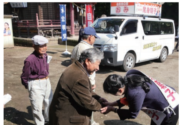
▲皆様の温かいご声援に感激