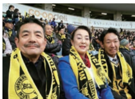
▲全国高校サッカー選手権大会 前橋育英高校決勝戦をスタンド にて応援しました 初優勝おめでとうございます!