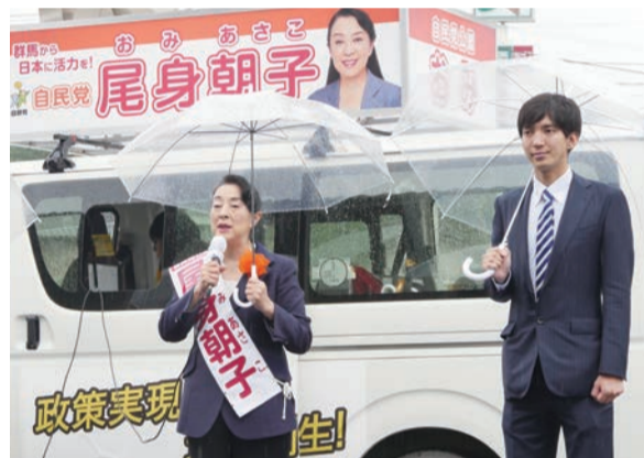
▲息子達の応援を受けて