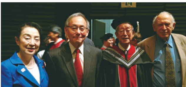
▲父・尾身幸次(元財務大臣)の発案により設立された沖縄科学技術大学院大学。初めての学位授与式が行われ、名誉博士号が授与されました(ノーベル賞受賞者、チュー博士・フリードマン博士と共に)