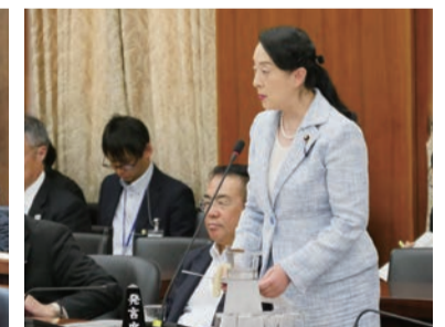
▲文部科学委員会での「文化財保護法案等改正案」に対し、地域の祭りや神楽などの無形文化財の保護・活用を政府へ要望する質疑を行いました