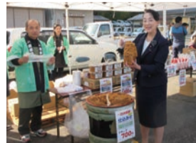
▲農業まつりで 味噌のつめ放題に挑戦! 各地区で農産物評会や新鮮野菜 の即売など盛り沢山のイベントで にぎわいました