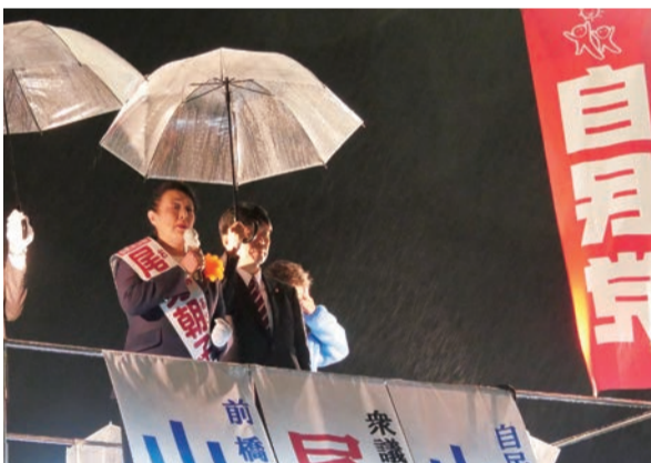
▲最終日、前橋駅前豪雨の中の演説