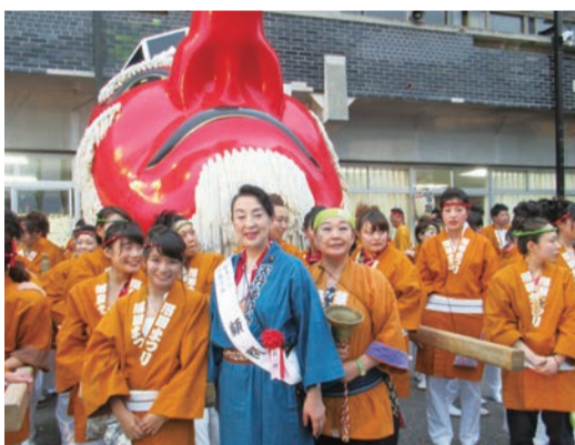
▲沼田まつり 迦葉山の犬天狗みこし等が街中を練り歩く 勇壮な沼田まつりに毎年、顧問として参加 しています