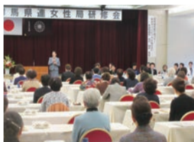
▲自由民主党 群馬県連女性局研修会 女性がもっと活躍できる環境を整える ため、皆様と意見交換を行いました