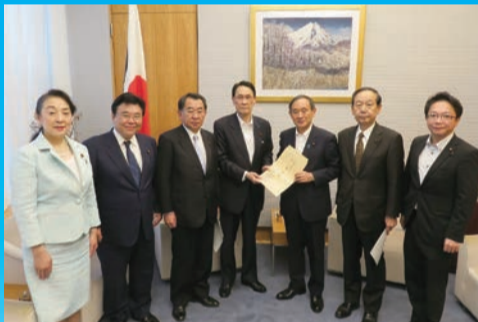
▲科学技術振興に関して菅官房長官に要望の申し入れ