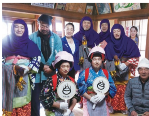
▲川場村 春駒まつり 男性が女性に扮して門前地区内の家々を巡り、 家内安全と養蚕豊作を祈願する春駒まつり 大切に守り続けて行きたい貴重な伝承文化です