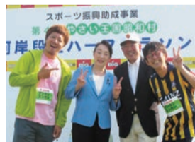
▲昭和村 河岸段丘ハーフマラソン 目の前に広がる広大な野菜畑の中、 高低差のあるコースを走る ランナーの皆さんを地元スタッフと 共に応援しています