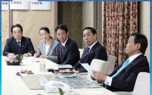
▲中小企業の事業承継税制等について麻生財務大臣に申し入れ