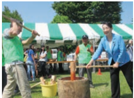
▲餅つきにチャレンジ! 昔ながらの杵と臼を使って ついた餅の味は格別です