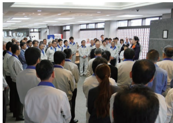
▲地元企業の皆様にもご支援頂きました