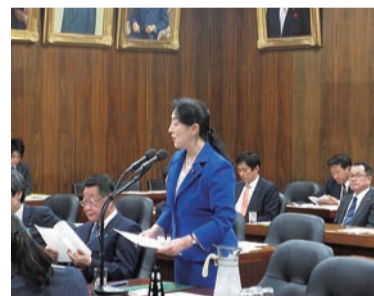
▲経済産業委員会 経済産業委員会で地元中小企業の皆様の声を盛り込みながら、「生産性の向上特別措置法案」等に対する質疑を行いました