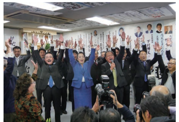
▲喜びに沸いた万歳!