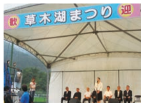
▲みどり市 草木湖まつり ダム建設により水没した 地域の元住民の皆様 の思いがこもったお祭りです