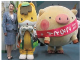
▲前橋のキャラクターころとん ・ぐんまちゃんと一緒に 地元群馬のPR活動 を行っています