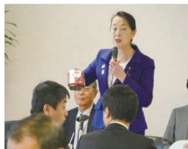
▲清和政策研究会議員総会にて、川場村の「木質バイオマス発電所」の排熱を利用した、「森林のいちご園」を紹介しました